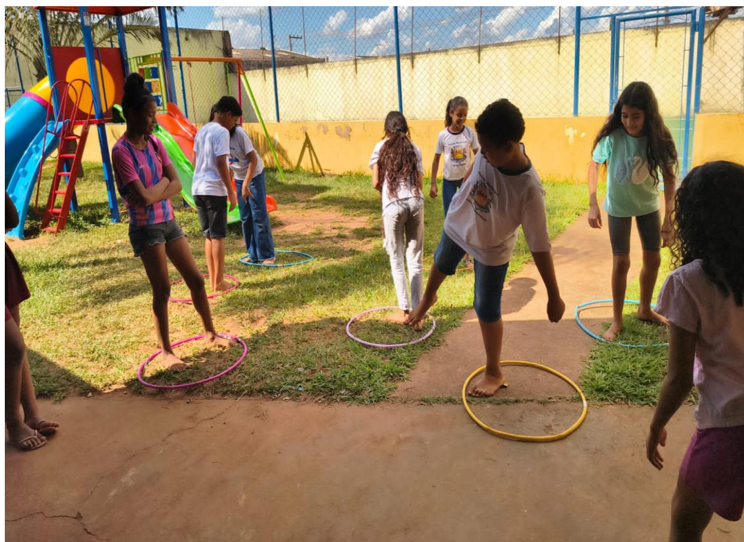
Oficina de Recreação

Utilidade Pública Federal pela Portaria nº 972 de 2 de agosto de 2002