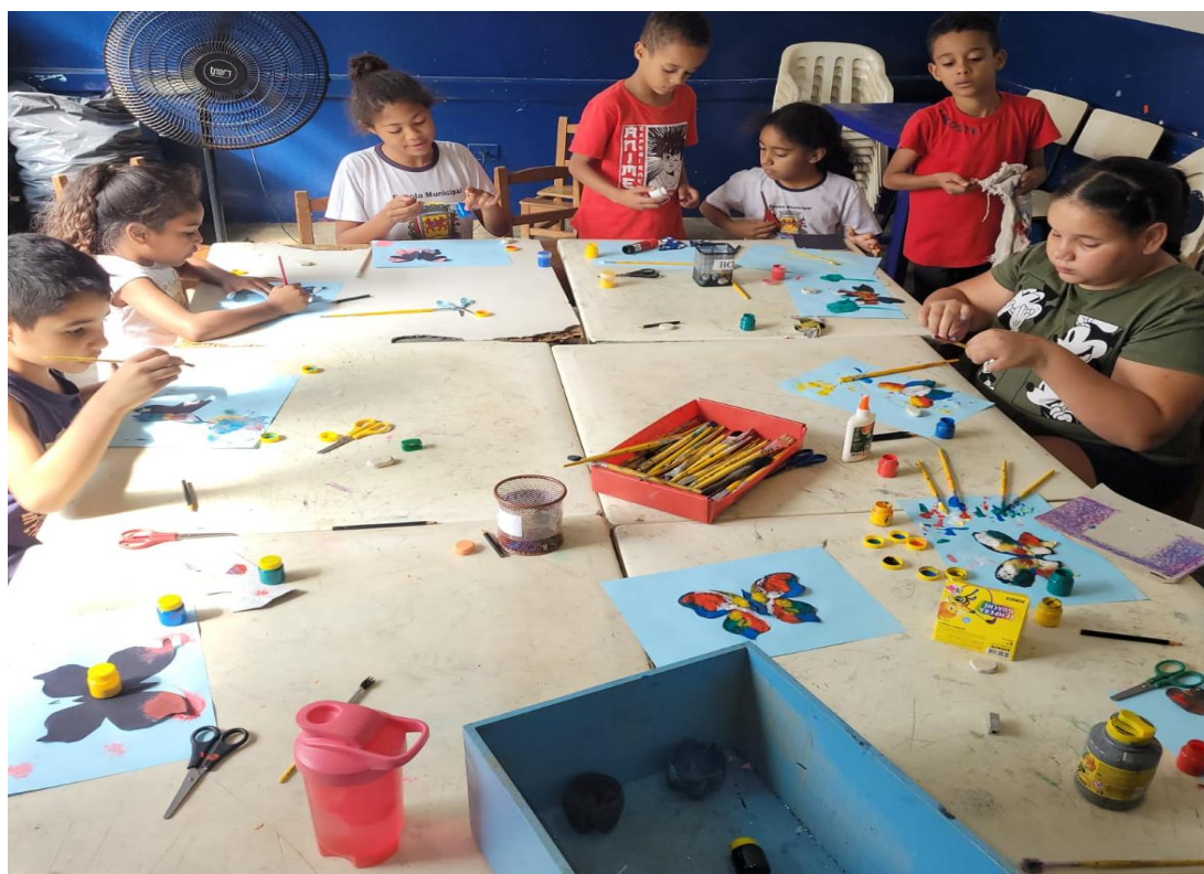
Oficina de Artes

Rua Manoel Leite de Araújo nº 279 – Parque Paulistano – CEP: 15612-234 – Fernandópolis-SP