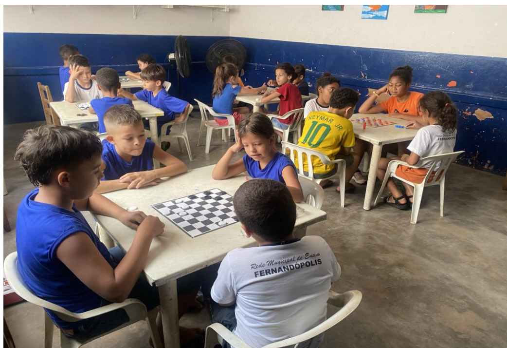
Oficina de jogos

Rua Manoel Leite de Araújo nº 279 – Parque Paulistano – CEP: 15612-234 – Fernandópolis-SP