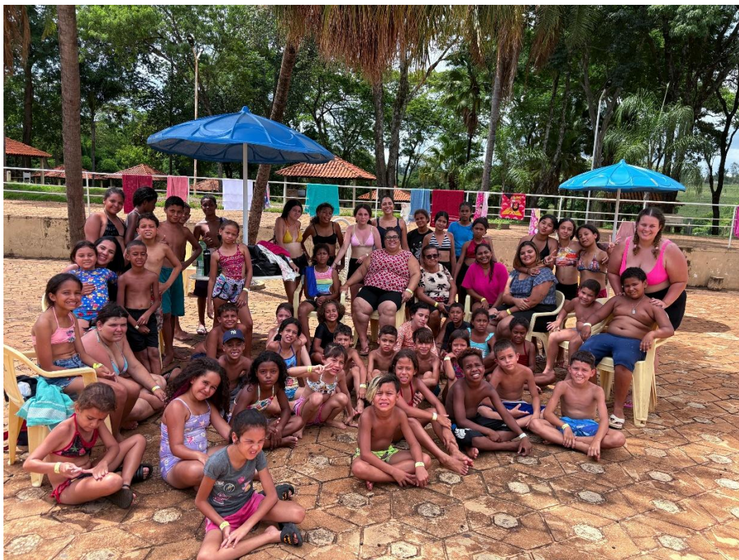
CMDCA – Data: 18/12/2025 – Passeio ao Parque Aquático Água Viva

Utilidade Pública Federal pela Portaria nº 972 de 2 de agosto de 2002