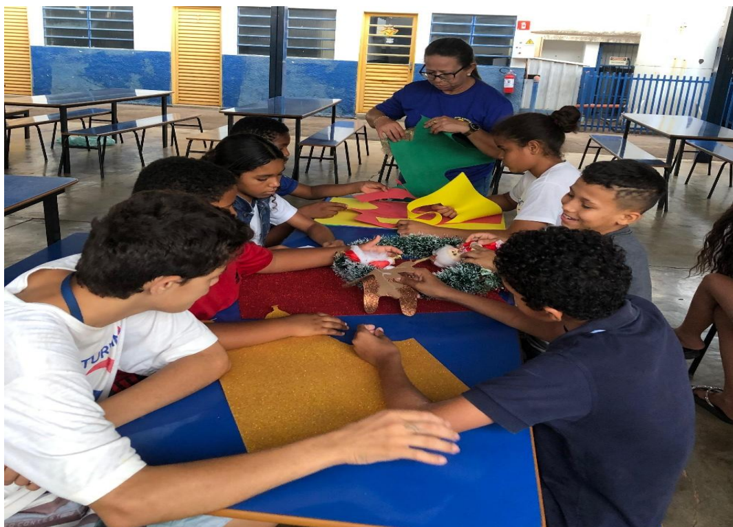
Oficina de Artes

Utilidade Pública Federal pela Portaria nº 972 de 2 de agosto de 2002