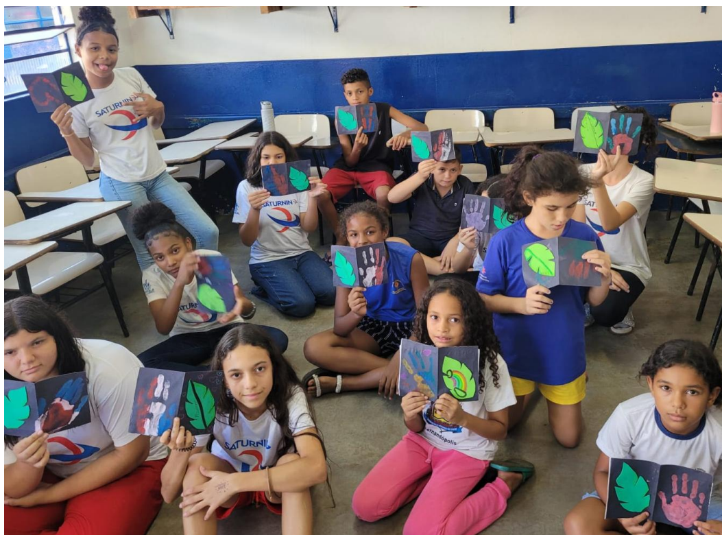
Oficina de Artes

Rua Manoel Leite de Araújo nº 279 – Parque Paulistano – CEP: 15612-234 – Fernandópolis-SP