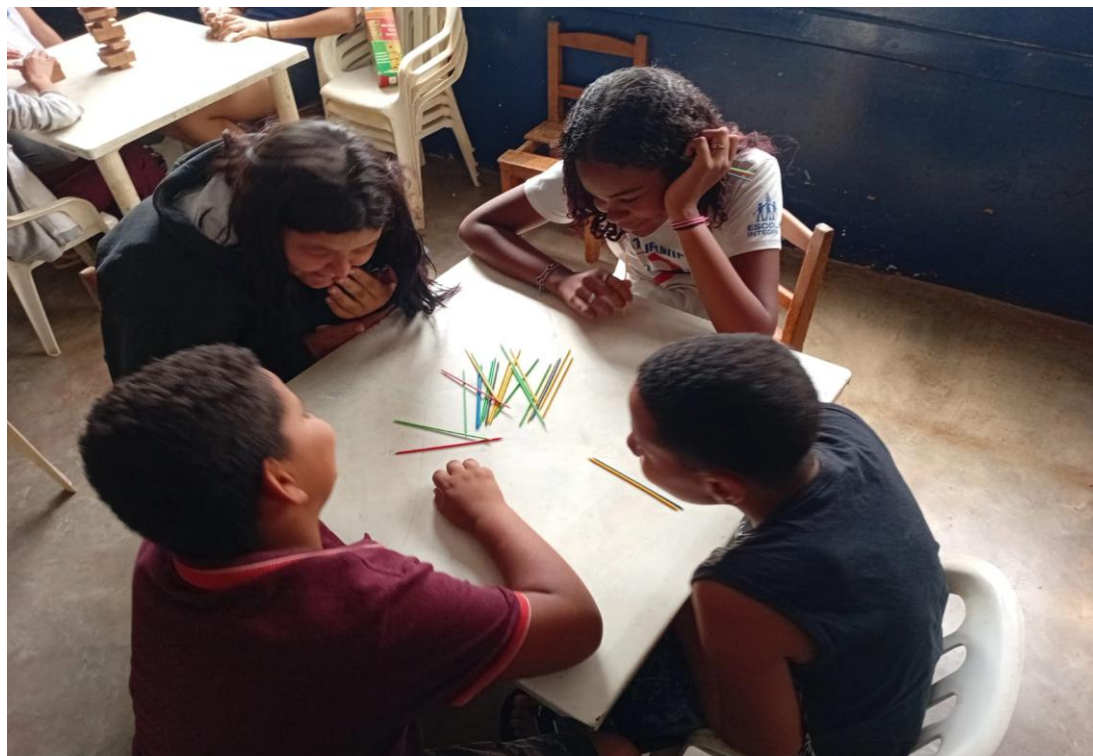
Oficina de jogos

Rua Manoel Leite de Araújo nº 279 – Parque Paulistano – CEP: 15612-234 – Fernandópolis-SP