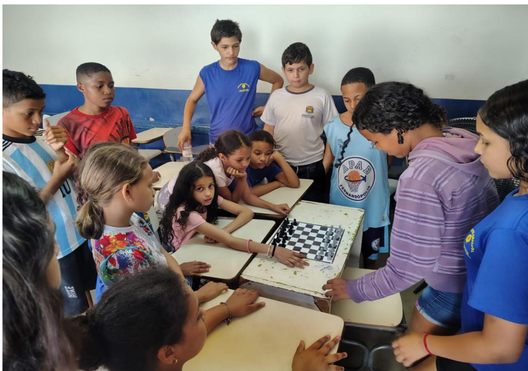
Oficina de jogos

Utilidade Pública Federal pela Portaria nº 972 de 2 de agosto de 2002