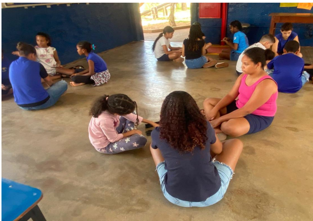
Oficina de jogos

Utilidade Pública Federal pela Portaria nº 972 de 2 de agosto de 2002