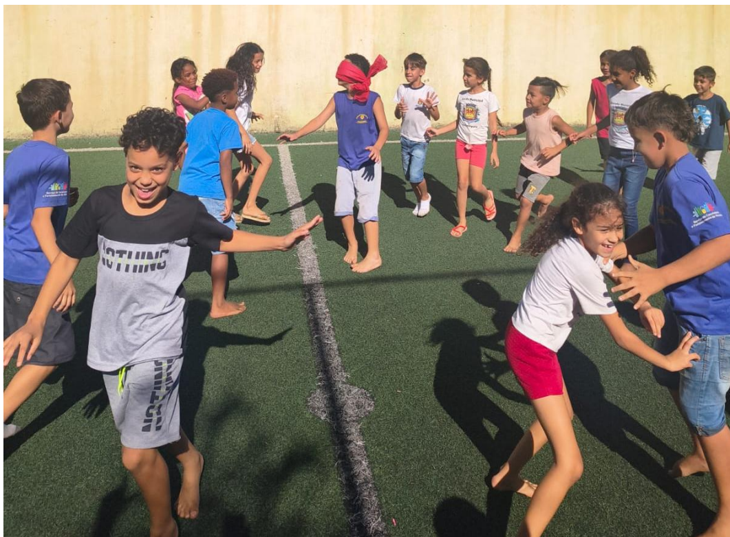
Oficina de Recreação

Utilidade Pública Federal pela Portaria nº 972 de 2 de agosto de 2002