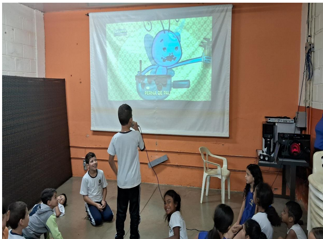
Oficina de Recreação

Utilidade Pública Federal pela Portaria nº 972 de 2 de agosto de 2002