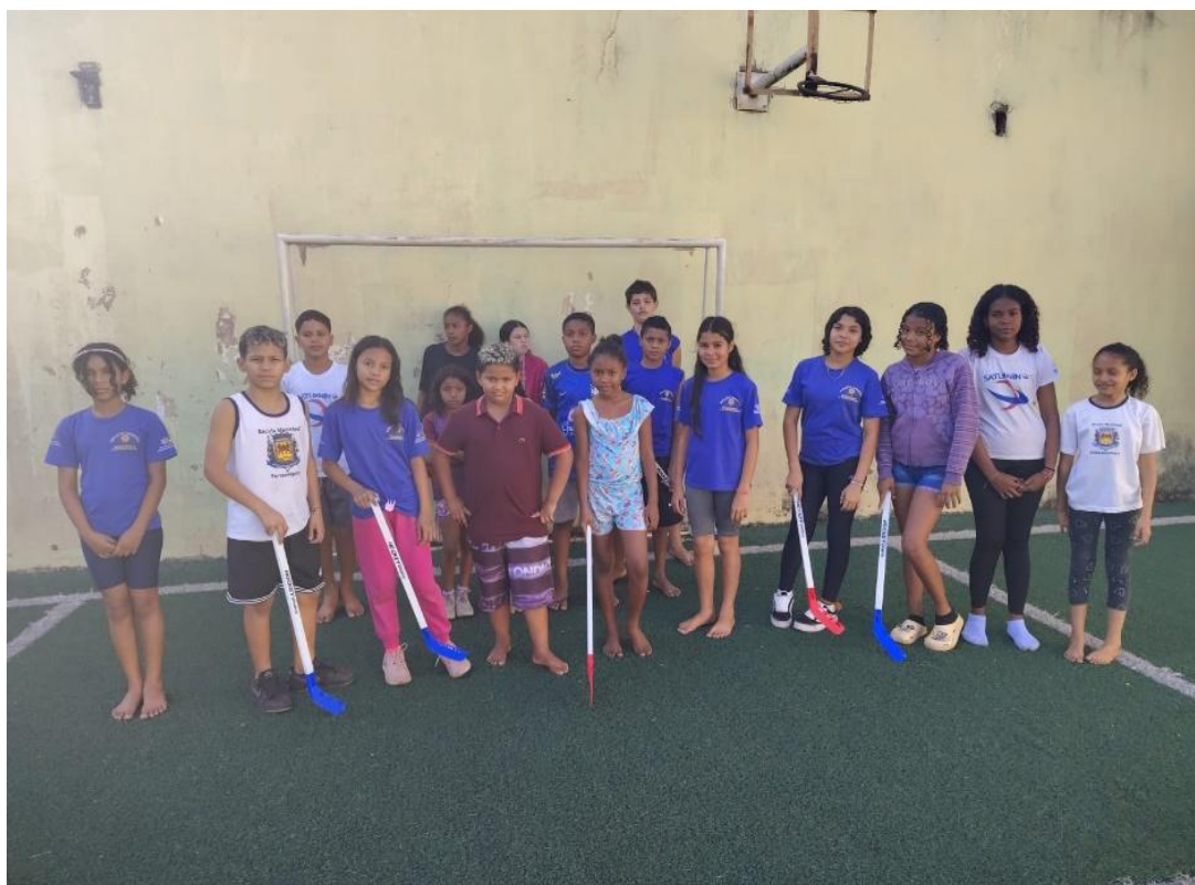
Oficina de Atividades Esportivas

Utilidade Pública Federal pela Portaria nº 972 de 2 de agosto de 2002