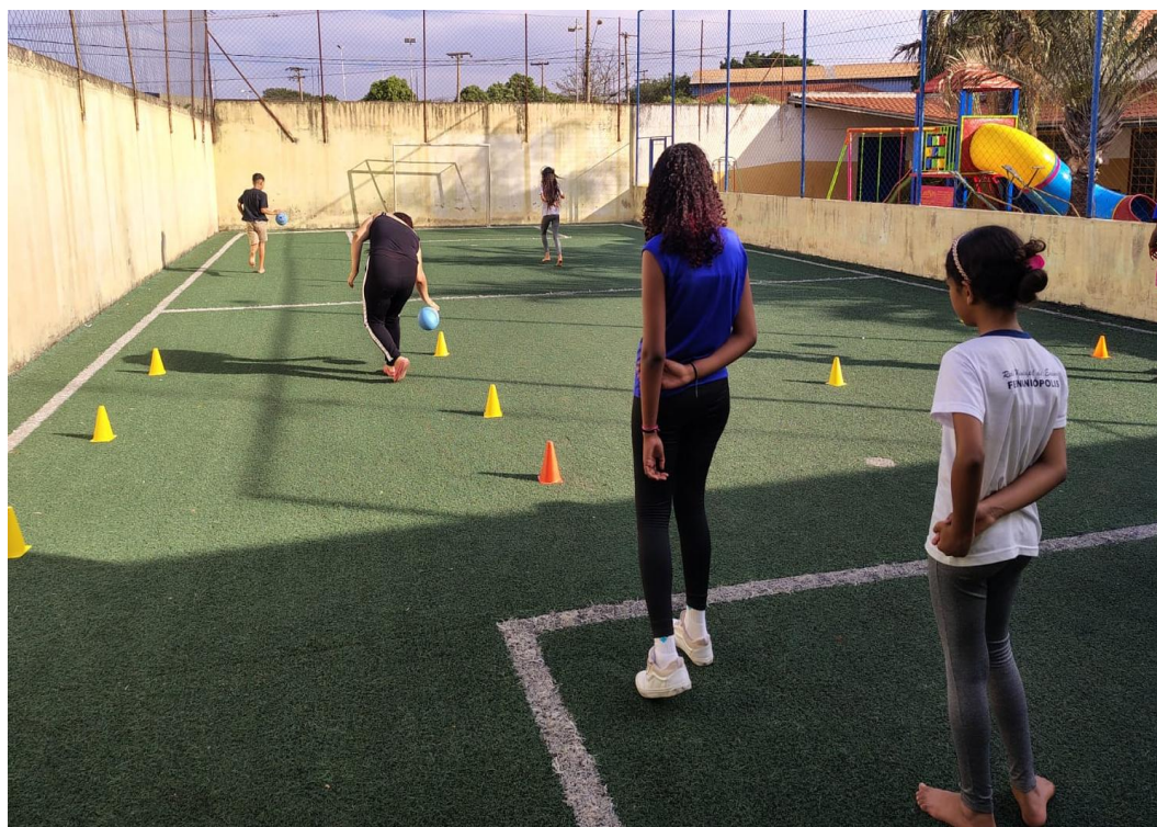
Oficina de Atividades Esportivas

Rua Manoel Leite de Araújo nº 279 – Parque Paulistano – CEP: 15612-234 – Fernandópolis-SP