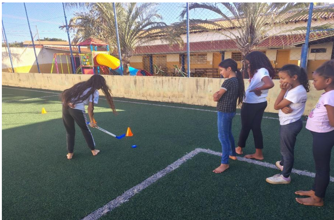
Oficina de Atividades Esportivas

Rua Manoel Leite de Araújo nº 279 – Parque Paulistano – CEP: 15612-234 – Fernandópolis-SP