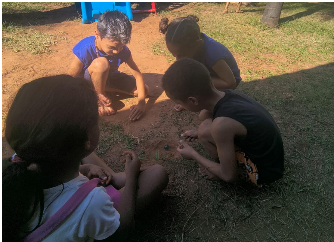
Oficina de Recreação

Utilidade Pública Federal pela Portaria nº 972 de 2 de agosto de 2002