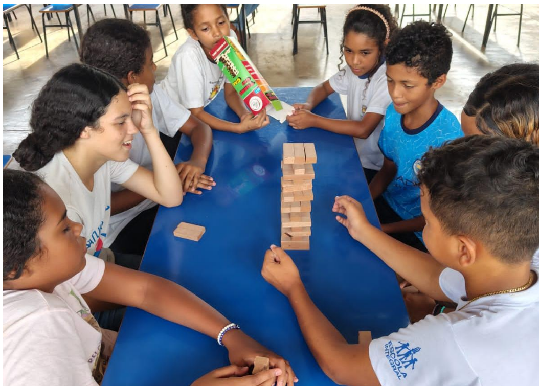
Oficina prática de jogos

Rua Manoel Leite de Araújo nº 279 – Parque Paulistano – CEP: 15612-234 – Fernandópolis-SP