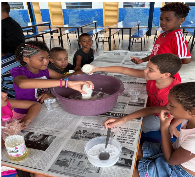
Oficina de Recreação

Utilidade Pública Federal pela Portaria nº 972 de 2 de agosto de 2002