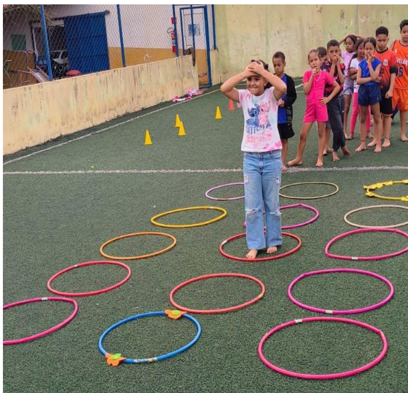
Oficina de Recreação

Utilidade Pública Federal pela Portaria nº 972 de 2 de agosto de 2002