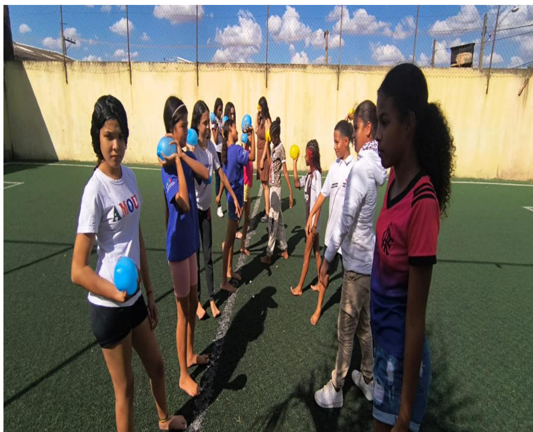
Oficina de Recreação

Rua Manoel Leite de Araújo nº 279 – Parque Paulistano – CEP: 15612-234 – Fernandópolis-SP