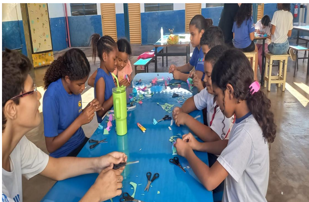
Oficina de Artes

Rua Manoel Leite de Araújo nº 279 – Parque Paulistano – CEP: 15612-234 – Fernandópolis-SP