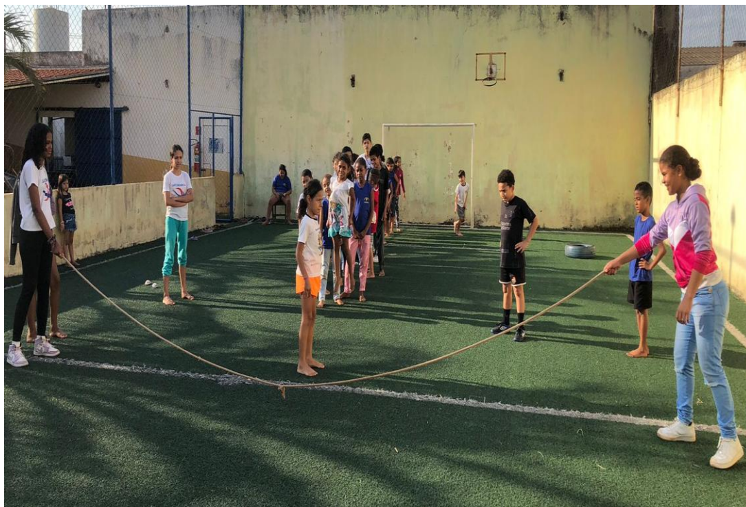
Oficina de Recreação

Utilidade Pública Federal pela Portaria nº 972 de 2 de agosto de 2002