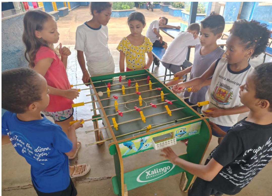
Oficina de jogos

Rua Manoel Leite de Araújo nº 279 – Parque Paulistano – CEP: 15612-234 – Fernandópolis-SP