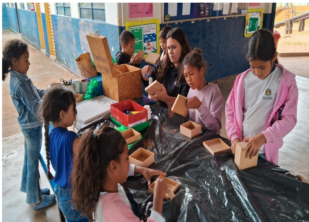
Oficina de Artes

Rua Manoel Leite de Araújo nº 279 – Parque Paulistano – CEP: 15612-234 – Fernandópolis-SP