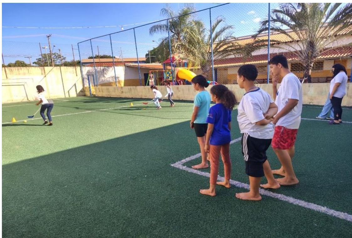
Oficina de Atividades Esportivas

Utilidade Pública Federal pela Portaria nº 972 de 2 de agosto de 2002