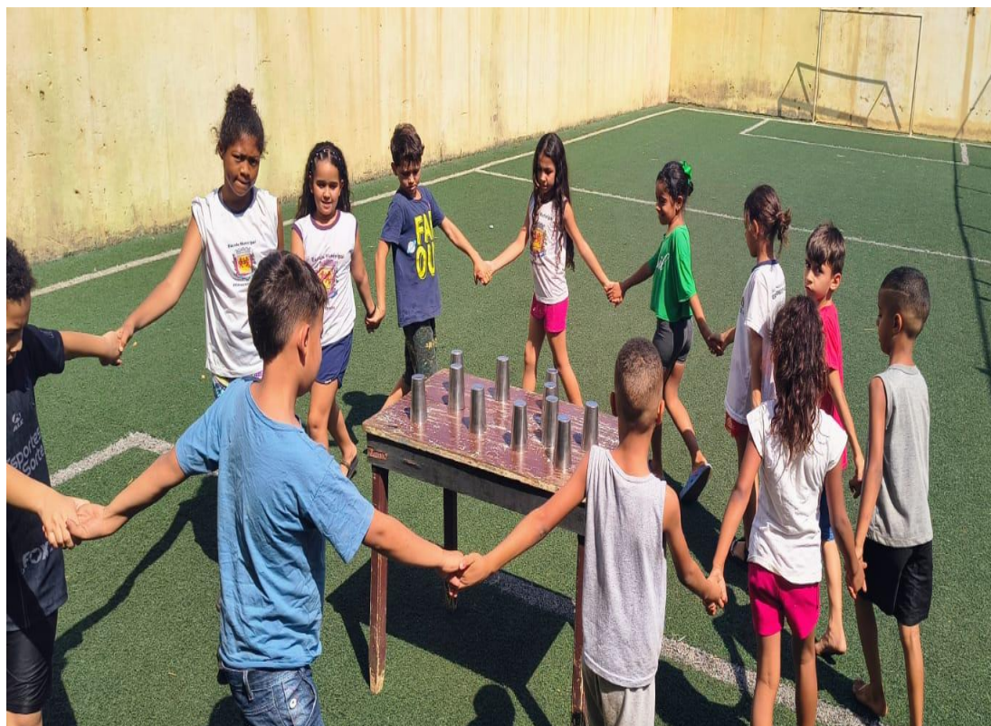
Oficina de Recreação

Rua Manoel Leite de Araújo nº 279 – Parque Paulistano – CEP: 15612-234 – Fernandópolis-SP