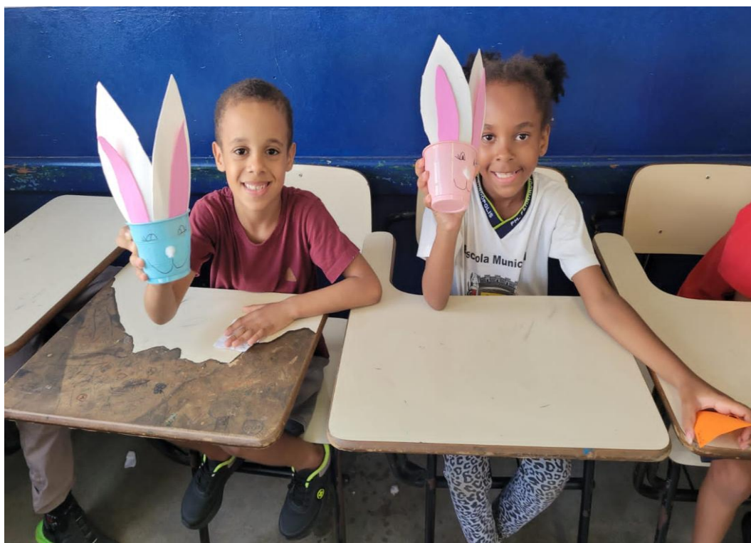
Oficina de artes

Rua Manoel Leite de Araújo nº 279 – Parque Paulistano – CEP: 15612-234 – Fernandópolis-SP