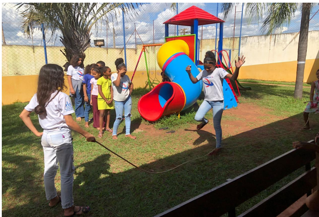
Oficina de Recreação

Utilidade Pública Federal pela Portaria nº 972 de 2 de agosto de 2002