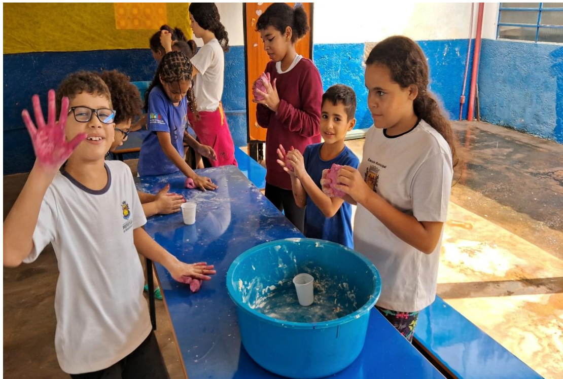
Oficina de Recreação