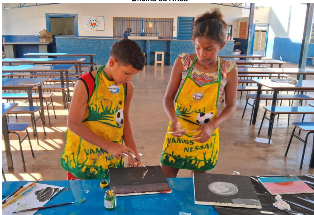
Oficina de Artes

Rua Manoel Leite de Araújo nº 279 – Parque Paulistano – CEP: 15612-234 – Fernandópolis-SP