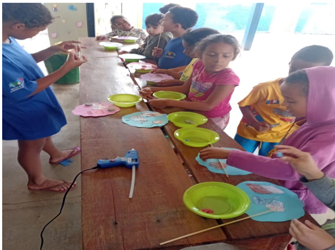
Oficina de Artes

Utilidade Pública Federal pela Portaria nº 972 de 2 de agosto de 2002