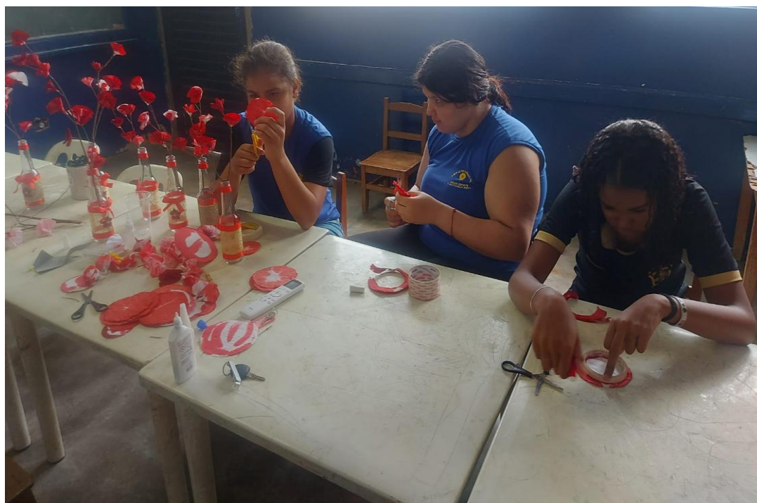
Oficina de Artes

Utilidade Pública Federal pela Portaria nº 972 de 2 de agosto de 2002