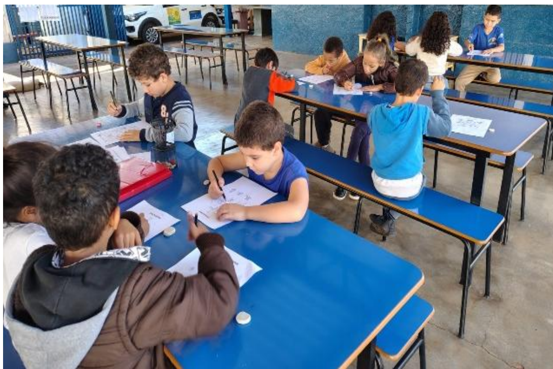
Oficina de jogos

Rua Manoel Leite de Araújo nº 279 – Parque Paulistano – CEP: 15612-234 – Fernandópolis-SP