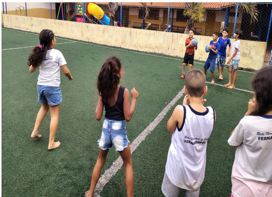
Oficina de Atividades Esportivas

Rua Manoel Leite de Araújo nº 279 – Parque Paulistano – CEP: 15612-234 – Fernandópolis-SP