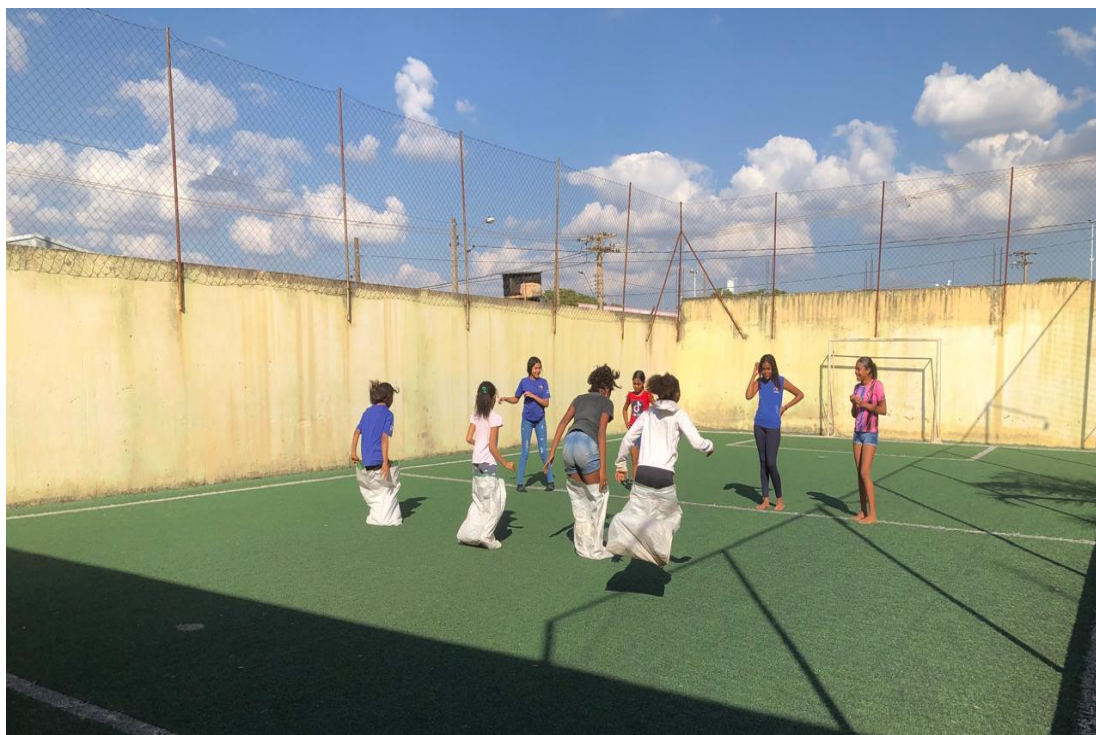
Oficina de Recreação

Rua Manoel Leite de Araújo nº 279 – Parque Paulistano – CEP: 15612-234 – Fernandópolis-SP