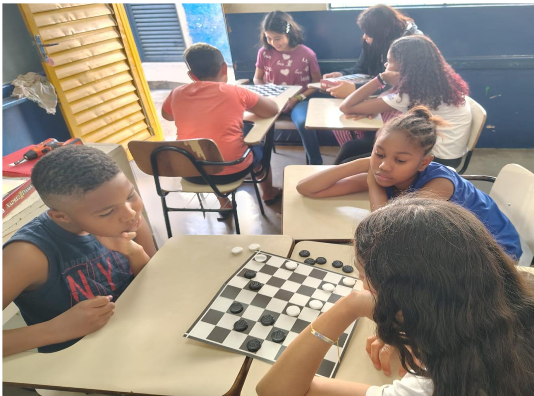
Oficina de jogos

Rua Manoel Leite de Araújo nº 279 – Parque Paulistano – CEP: 15612-234 – Fernandópolis-SP