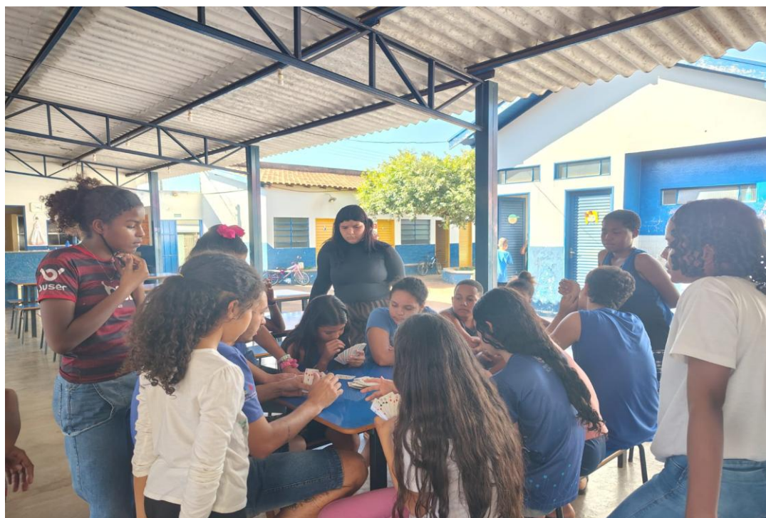
Oficina de jogos

Rua Manoel Leite de Araújo nº 279 – Parque Paulistano – CEP: 15612-234 – Fernandópolis-SP