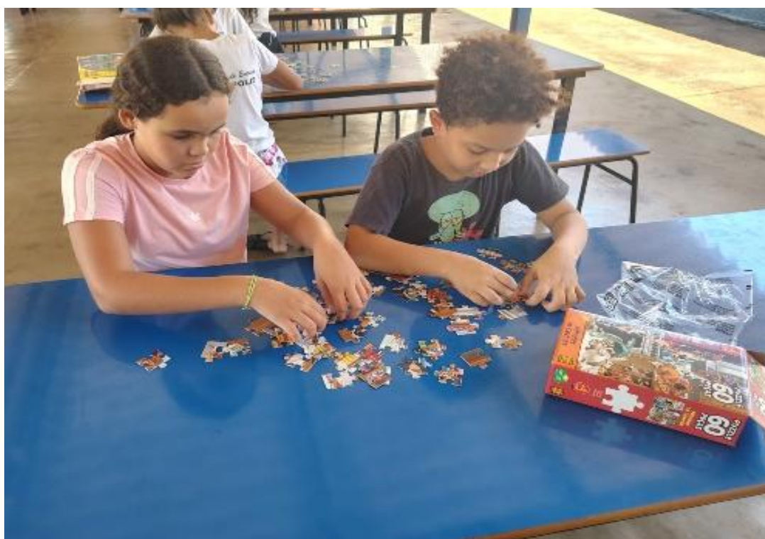
Oficina de jogos

Rua Manoel Leite de Araújo nº 279 – Parque Paulistano – CEP: 15612-234 – Fernandópolis-SP