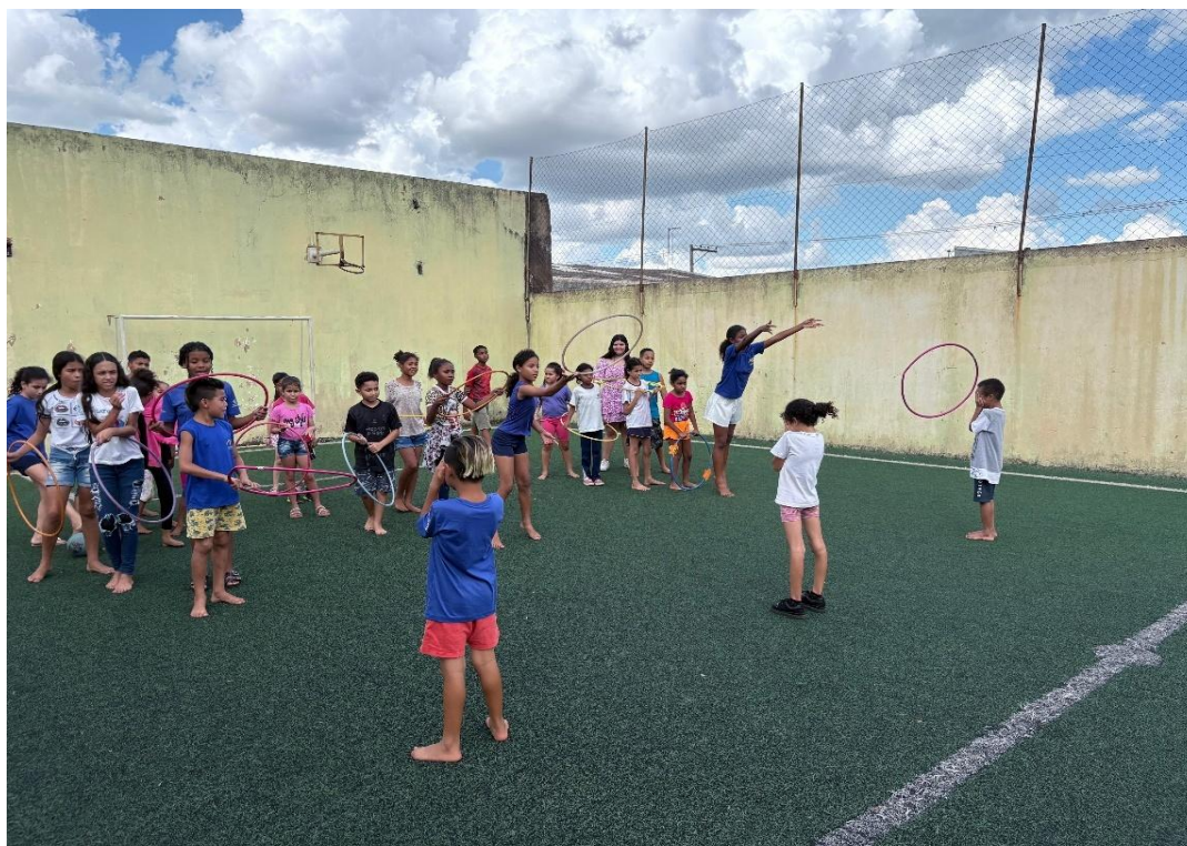
Oficina de Recreação

Rua Manoel Leite de Araújo nº 279 – Parque Paulistano – CEP: 15612-234 – Fernandópolis-SP