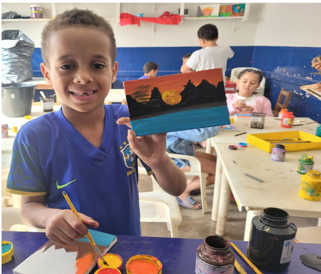
Oficina de Artes

Utilidade Pública Federal pela Portaria nº 972 de 2 de agosto de 2002