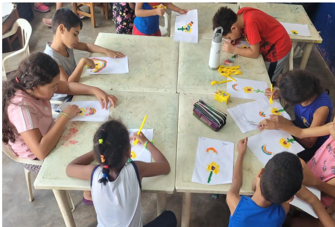
Oficina de artes

Rua Manoel Leite de Araújo nº 279 – Parque Paulistano – CEP: 15612-234 – Fernandópolis-SP