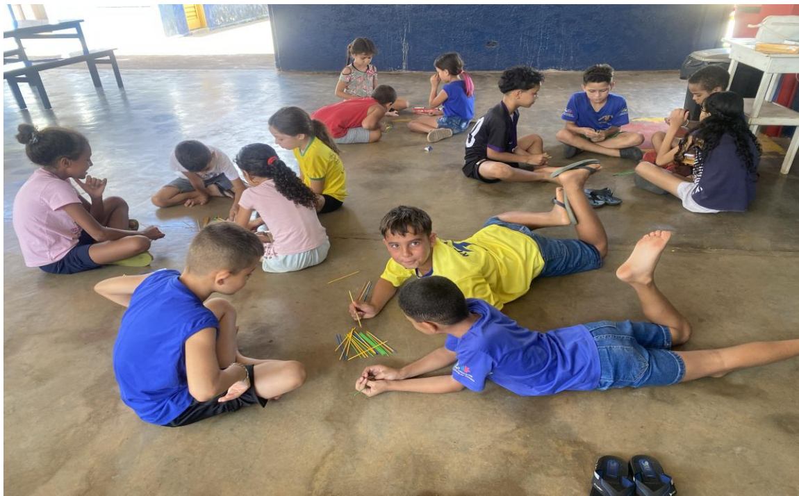
Oficina de jogos

Utilidade Pública Federal pela Portaria nº 972 de 2 de agosto de 2002