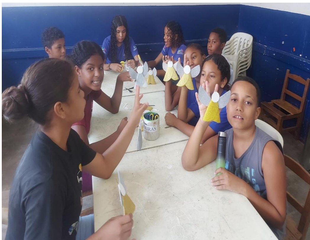
Oficina de Artes

Rua Manoel Leite de Araújo nº 279 – Parque Paulistano – CEP: 15612-234 – Fernandópolis-SP