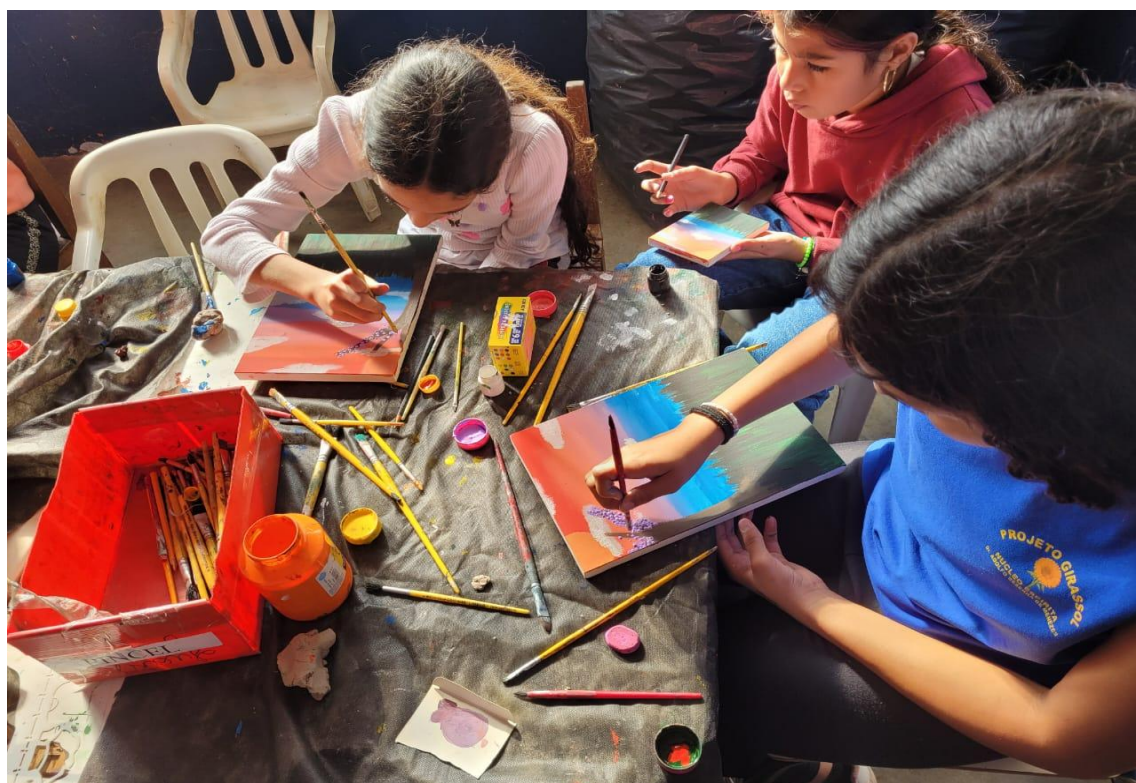
Oficina de Artes

Rua Manoel Leite de Araújo nº 279 – Parque Paulistano – CEP: 15612-234 – Fernandópolis-SP