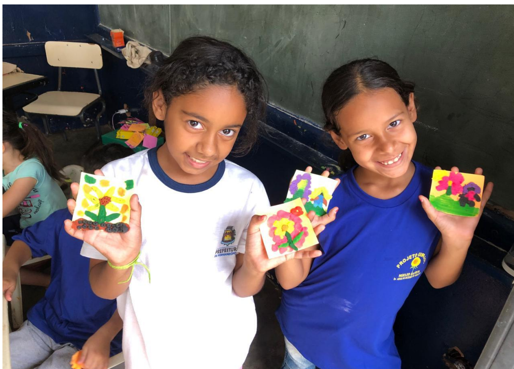
Oficina de Recreação

Utilidade Pública Federal pela Portaria nº 972 de 2 de agosto de 2002