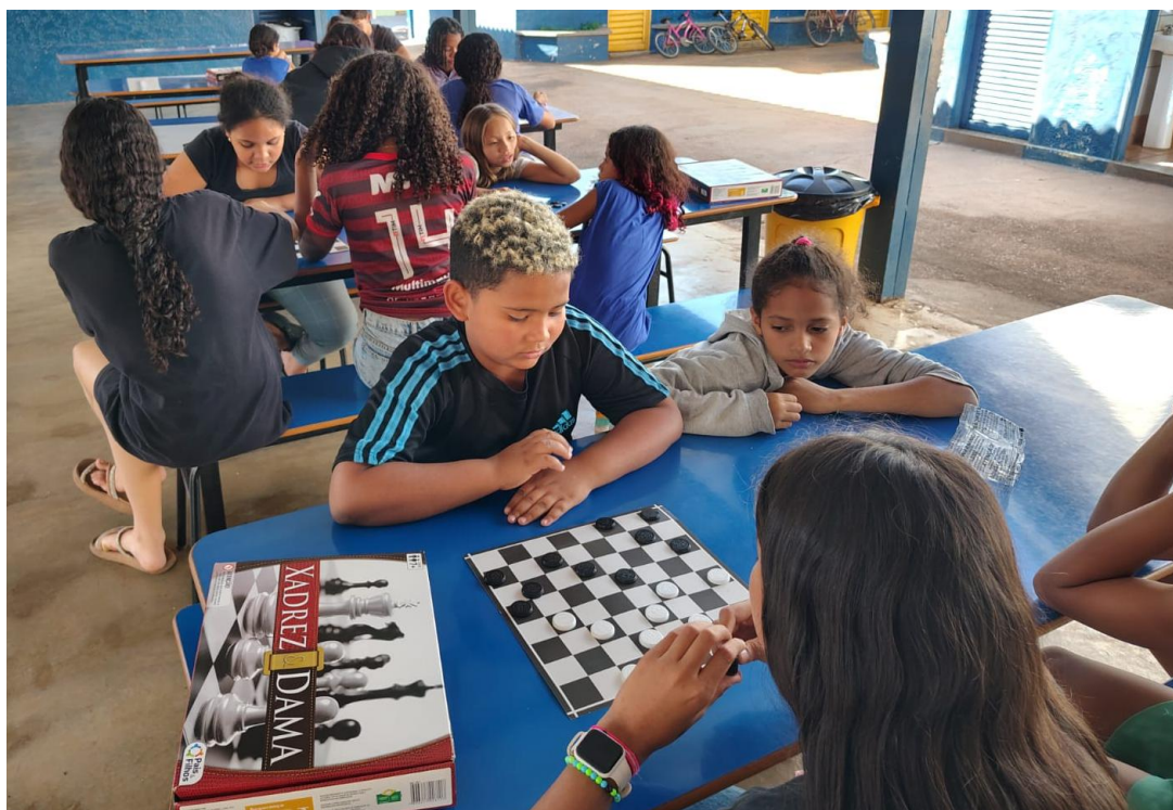
Oficina de jogos

Utilidade Pública Federal pela Portaria nº 972 de 2 de agosto de 2002