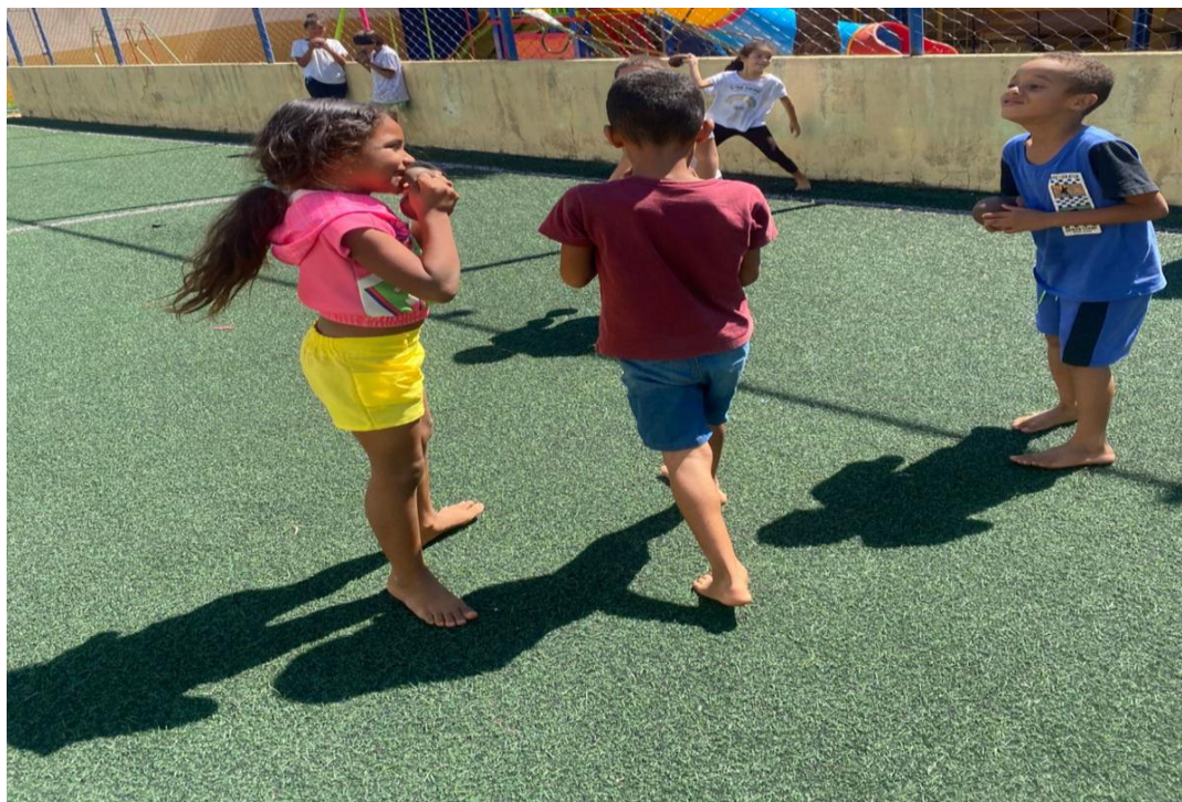
Oficina de Atividades Esportivas

Utilidade Pública Federal pela Portaria nº 972 de 2 de agosto de 2002