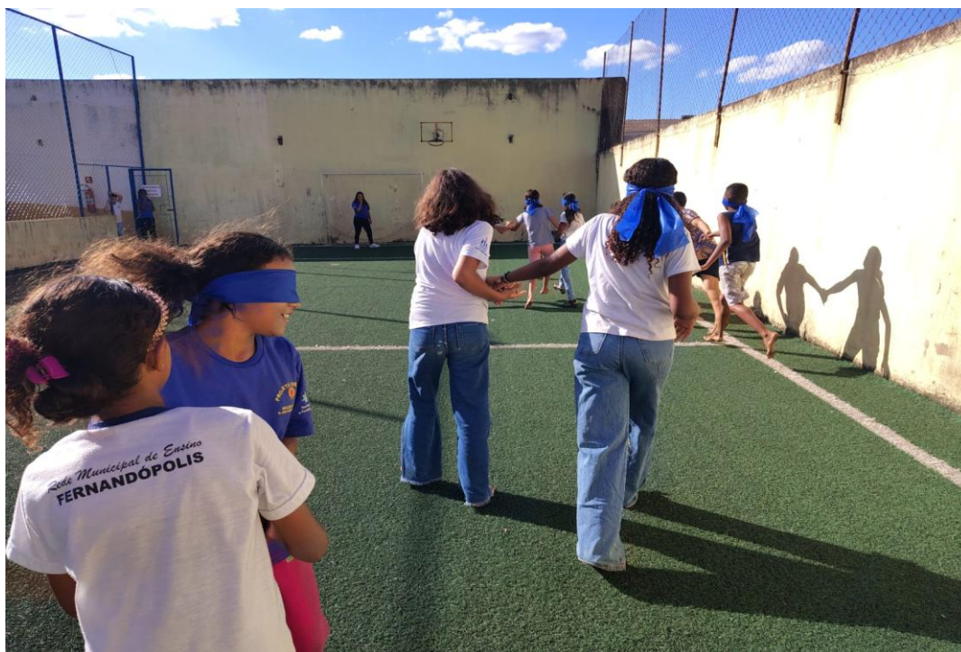
Oficina de Atividades Esportivas

Utilidade Pública Federal pela Portaria nº 972 de 2 de agosto de 2002