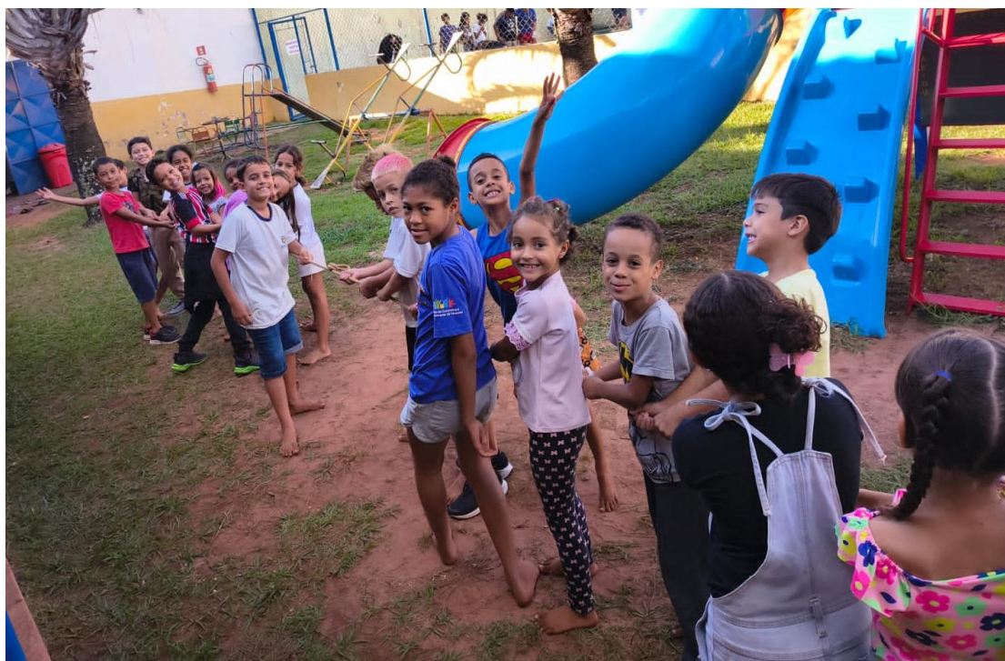
Oficina de Recreação

Utilidade Pública Federal pela Portaria nº 972 de 2 de agosto de 2002