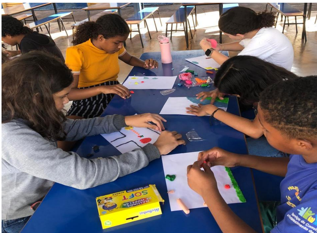
Oficina de Recreação

Utilidade Pública Federal pela Portaria nº 972 de 2 de agosto de 2002