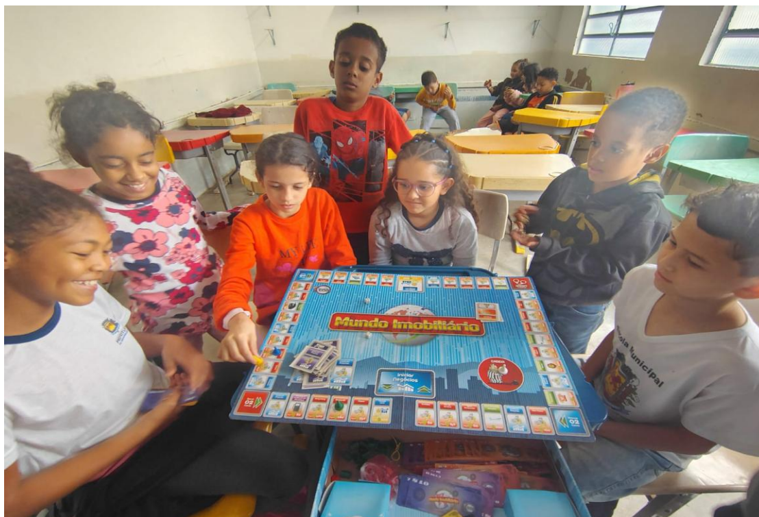
Oficina de jogos

Rua Manoel Leite de Araújo nº 279 – Parque Paulistano – CEP: 15612-234 – Fernandópolis-SP