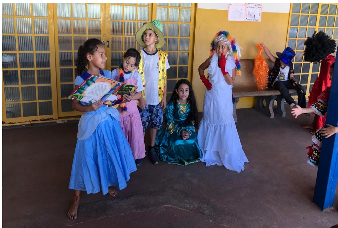
Oficina de Recreação

Utilidade Pública Federal pela Portaria nº 972 de 2 de agosto de 2002