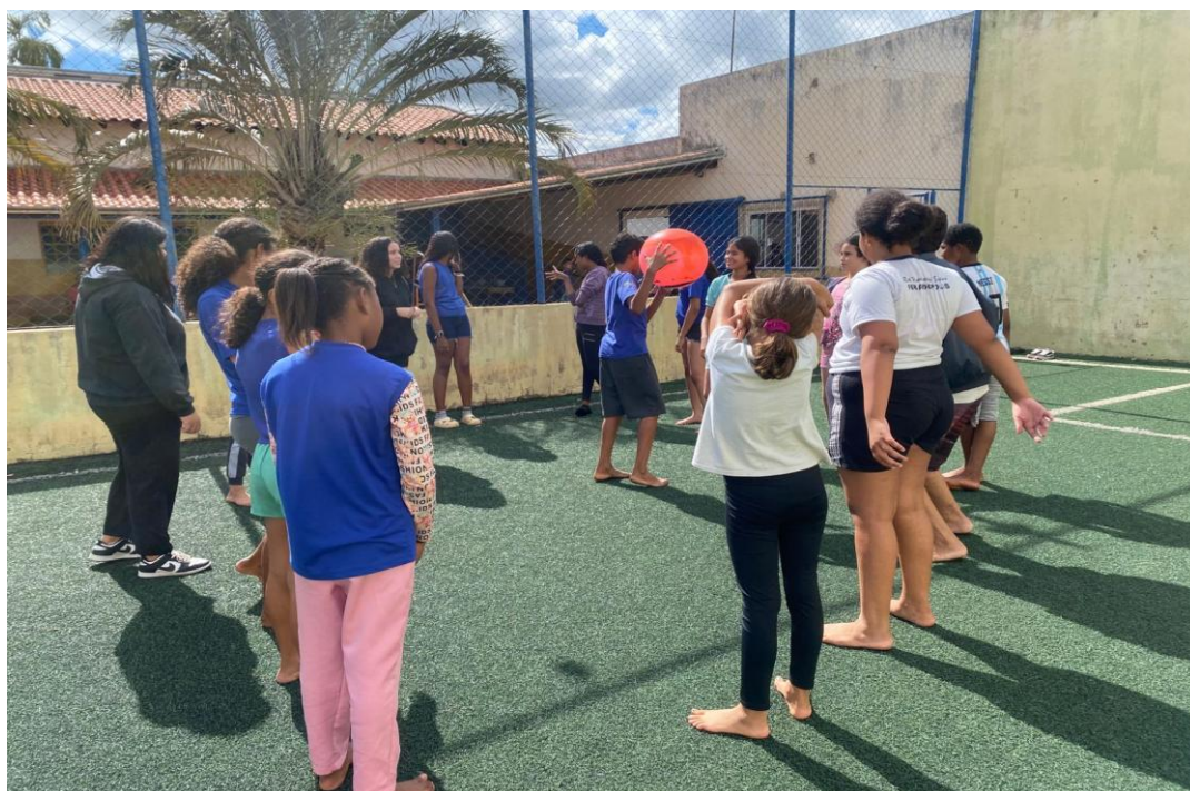
Oficina de Atividades Esportivas

Rua Manoel Leite de Araújo nº 279 – Parque Paulistano – CEP: 15612-234 – Fernandópolis-SP