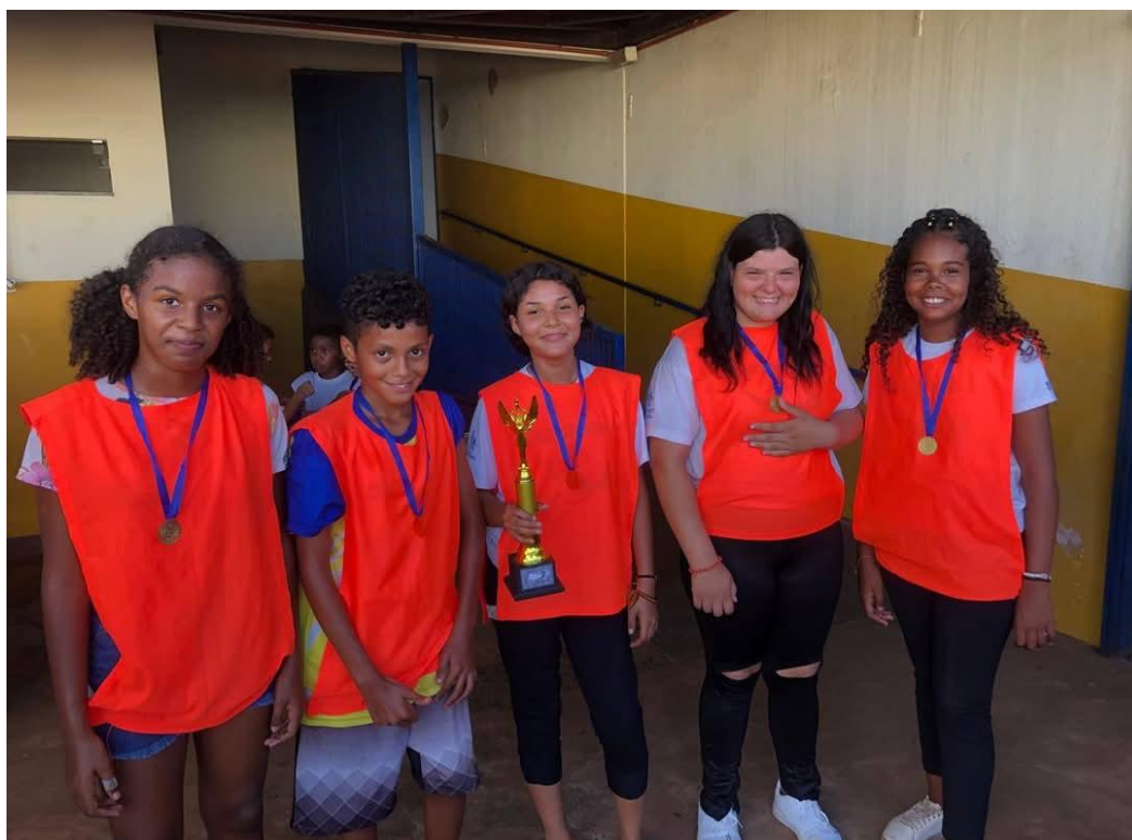
Oficina de esportes - Campeonato de Futebol

Utilidade Pública Federal pela Portaria nº 972 de 2 de agosto de 2002