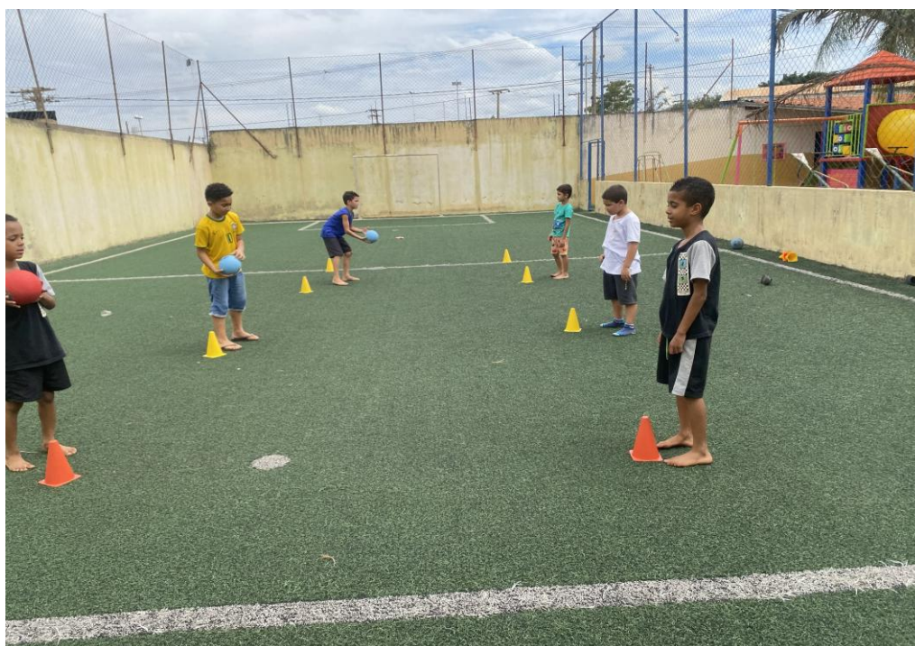
Oficina de Atividades Esportivas

Rua Manoel Leite de Araújo nº 279 – Parque Paulistano – CEP: 15612-234 – Fernandópolis-SP