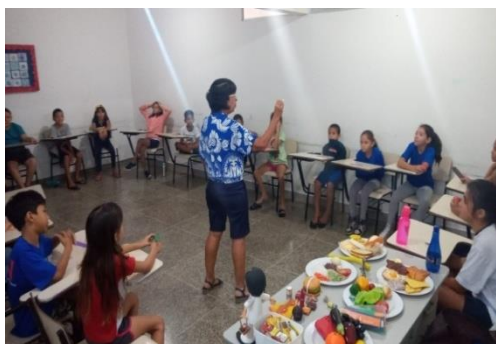
Atividade: Palestra sobre Alimentação saudável.