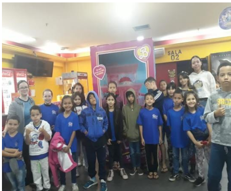
Passeio ao cinema