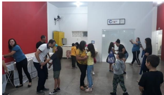
Brincadeiras com as crianças e familiares