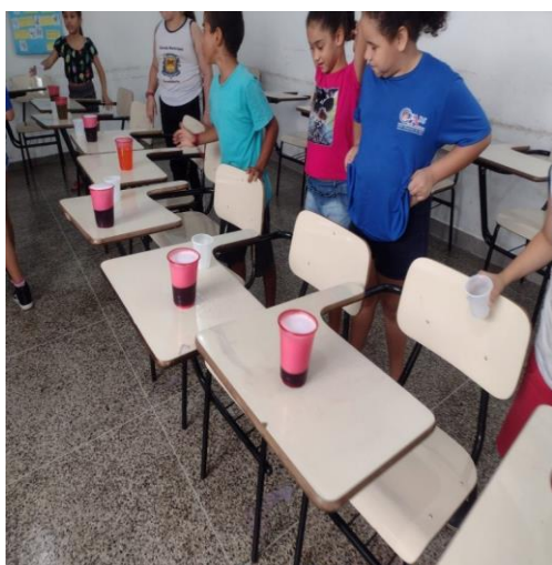
Oficina das Emoções