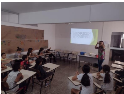
Palestra –Higiene Pessoal