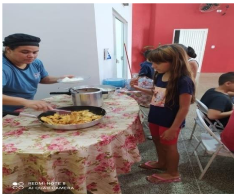
Alimentação ofertada pela OSC