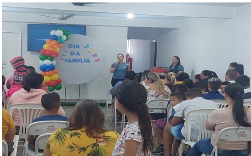
Dia da família