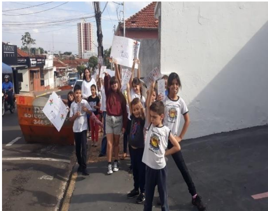
Atividade: Mobilização Trabalho Infantil Vips