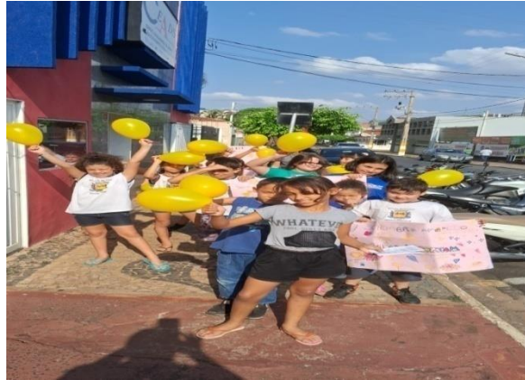
Ação setembro amarelo