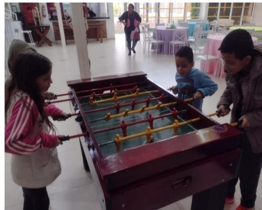
Atividade: Passeio no Espaço Vic