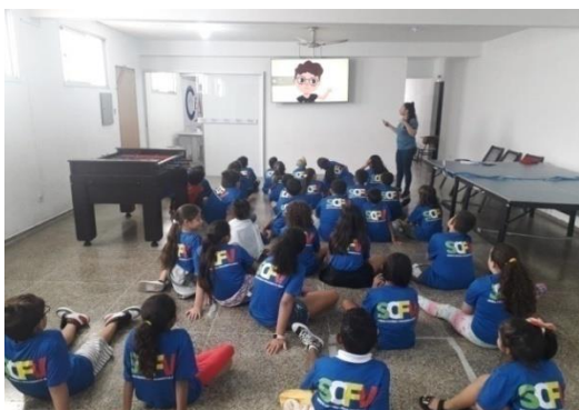
Oficina das emoções