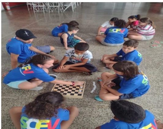
Oficina de Jogos pedagógicos