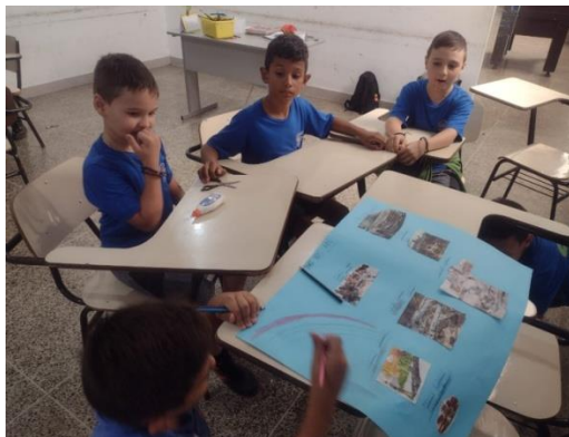
Ideias para fazer com os idosos