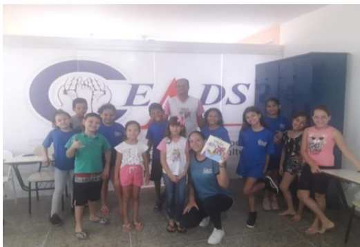
Atividade: Bate papo com a escritora mirim