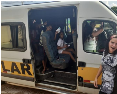
Transporte Terceirizado (Van)