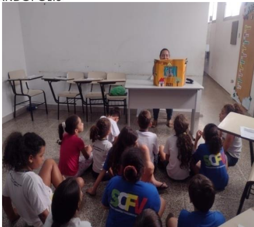
Oficina da emoções

R: Rio Grande do Sul nº 1349 – CEP: 15.600-067 – Fone: 3442-2424 - Fernandópolis/SP