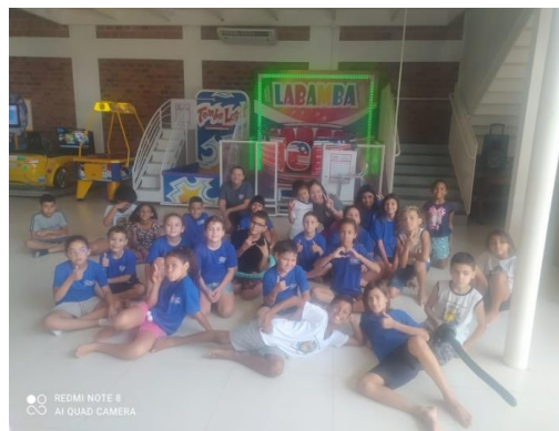
Passeio na Vic Vips