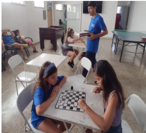
Oficina do jogos pedagógicos