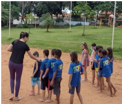
Oficina de Esportes