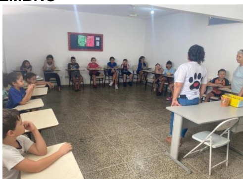
Bate papo com OSC Pelos e Patas