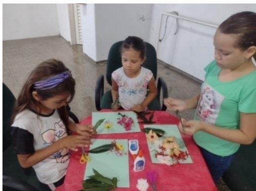
Atividade: Com elementos da natureza