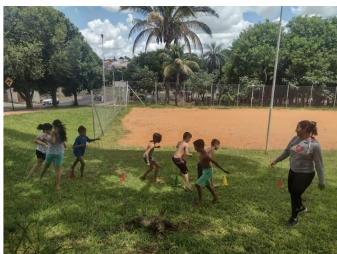
Oficina de esporte