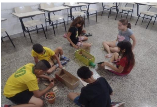
Atividade: Confeção de pebolim com matérias recicláveis