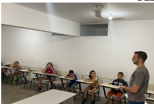
Palestra com Zoonoses de Fernandópolis