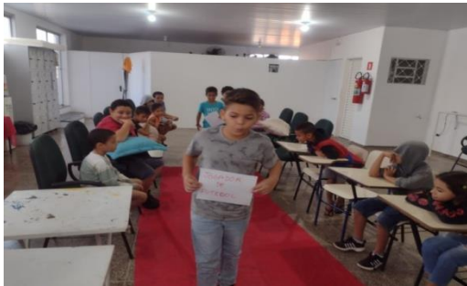
Atividade: Desfile da profissões