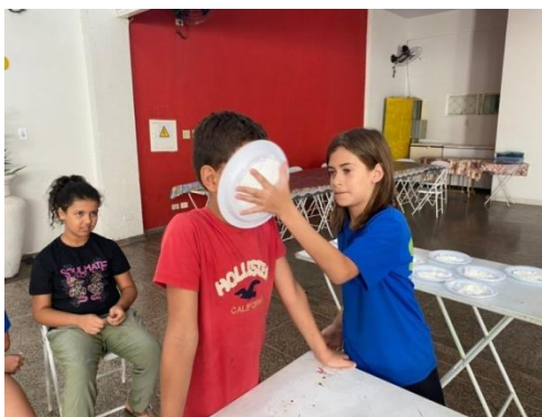
Brincadeira torta na cara