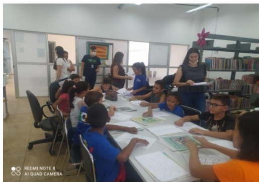
Visita no CRAS / Pracinha da cultura