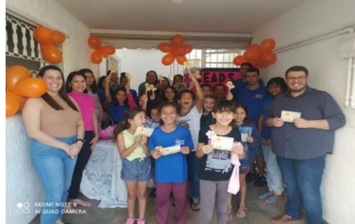
Atividade: Palestra com o CREAS