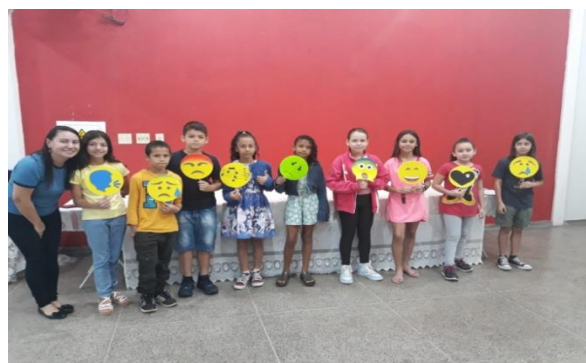
Teatro das emoções