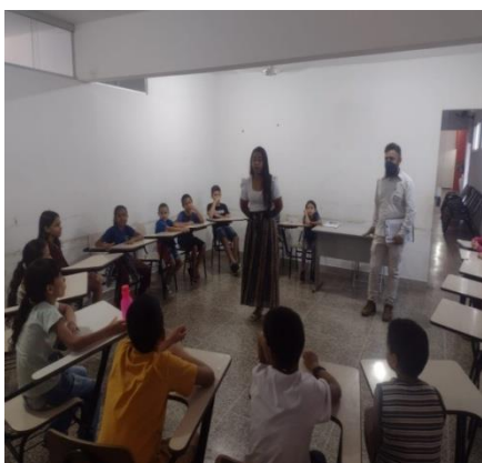
Atividade: Palestra com Conselho Tutelar