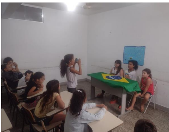
Atividade: Apresentação do Jornal do CEADS