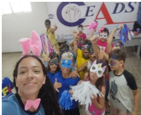
Atividade: Festa de carnaval