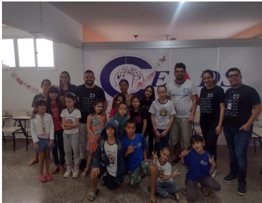
Palestra com APADAF