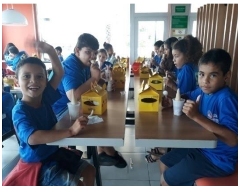
Atividade: Passeio MCDonald's