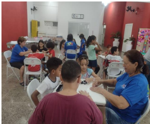
Encontro intergeracional crianças e idosos CEADS